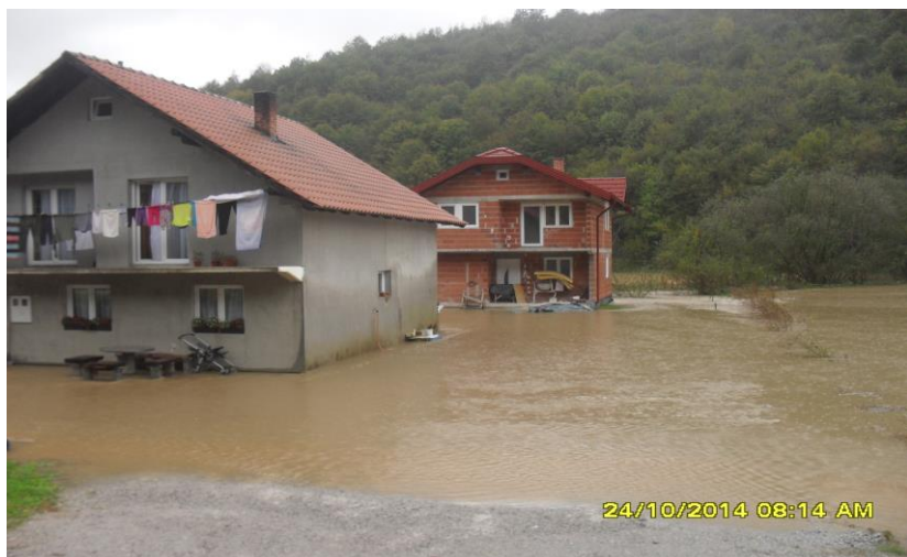
Slika 9. Poplave na području Čave – Suhodol 24.10.2014 godine.