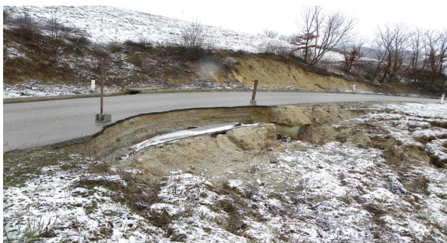
Slika 3. Ulica Alije Kedića