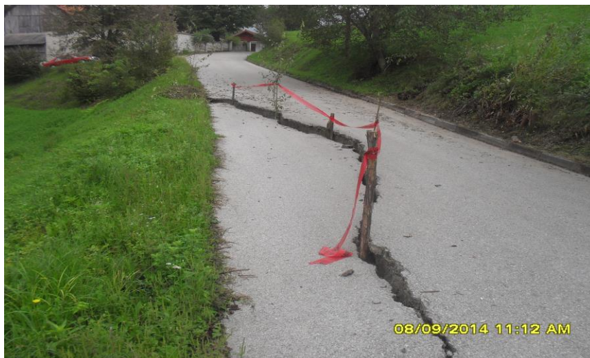
Slika 2. Klizište u MZ Bag, naselje Kaukovići