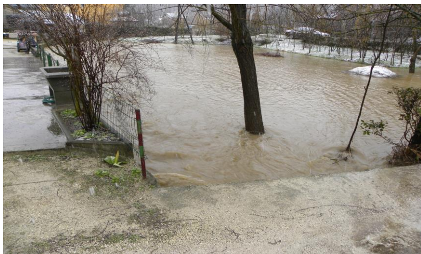
Slika 6. Poplave u Gornjim Mulalićima 12.02.2014. godine

Sve ove poplave uglavnom ugrožavaju prizemne prostorije stambenih objekata, pomoćne objekte (šupe, garaže, štale), poljoprivredno zemljište, poslovne prostore i infrastrukturne objekte ( mostove, saobraćajnice, izvorišta i vodovodne instalacije, podzemne telefonske instalacije i dr.).