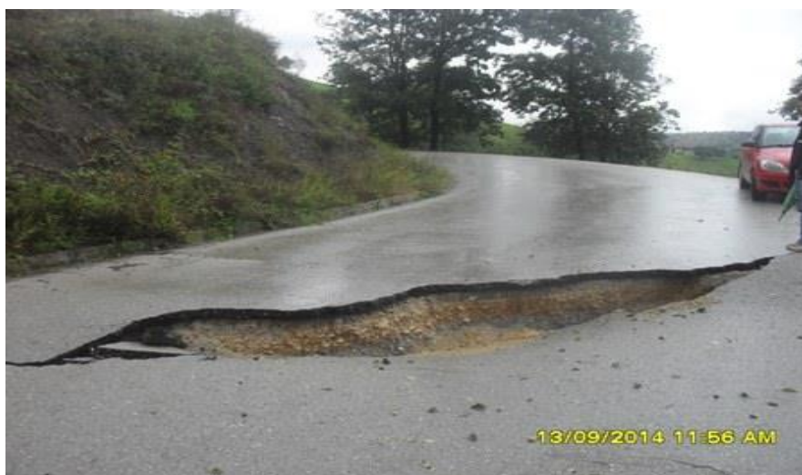
Slika 4. Klizište u naselju Hilići-Kedići – Elkasova Rijeka