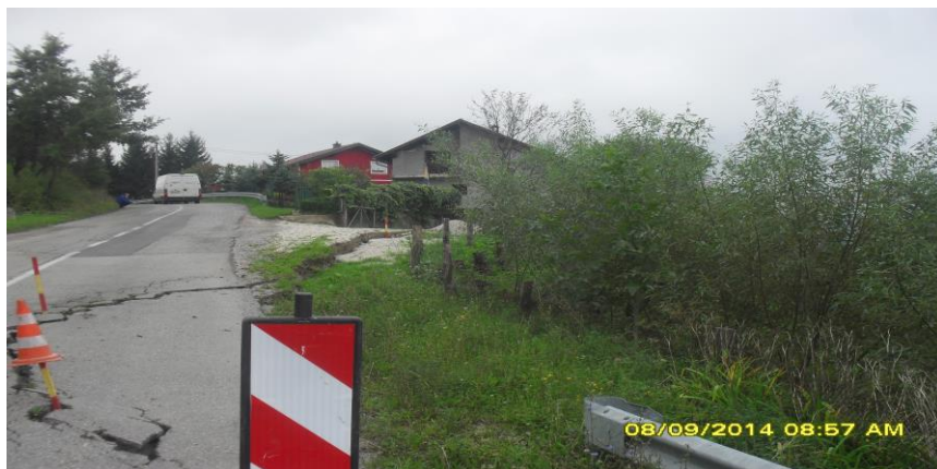
Slika 1. Klizište u Mjesnoj zajednici Konjodor na RP 401 b.

Primjer štetnog djelovanja klizanja zemljišta na putnim komunikacijama na području općine Bužim.