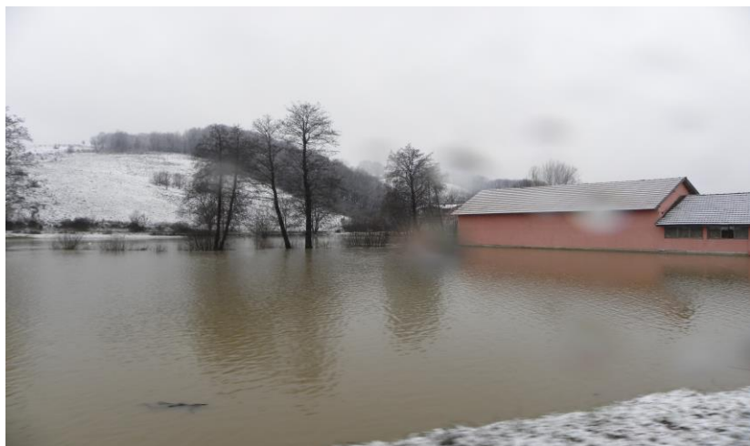
Slika 7. Poplave V.Rijeka (raskrsnica Dančilovac) 12.02.2014. godine