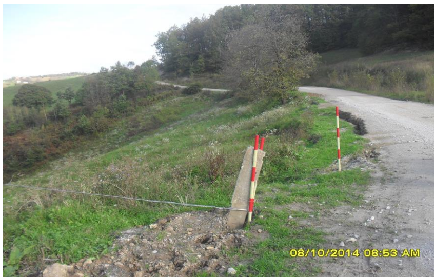
Slika 5. Klizište na Lokalnom putu Radoč-Čava