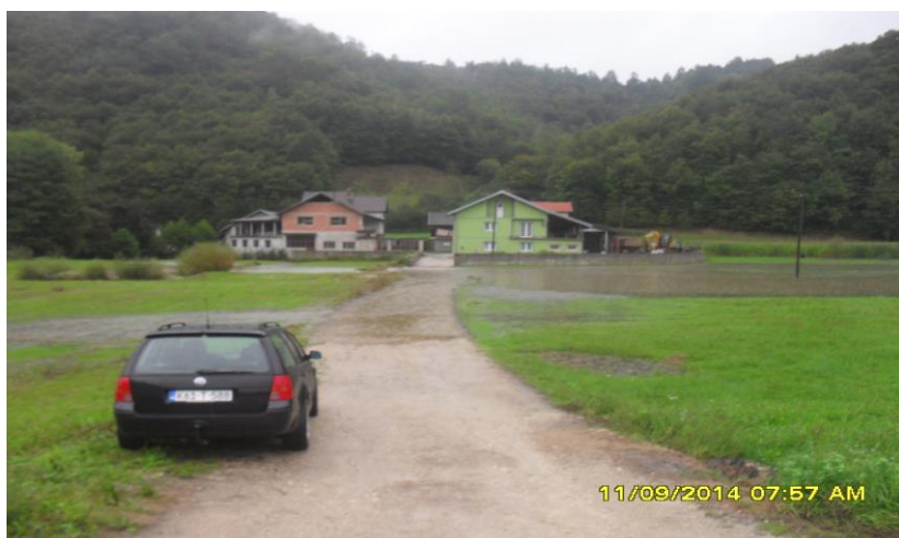
Slika 8. Poplave na području naselja Malovan 11.09.2014 godine na granici sa općinom V. Kladuša